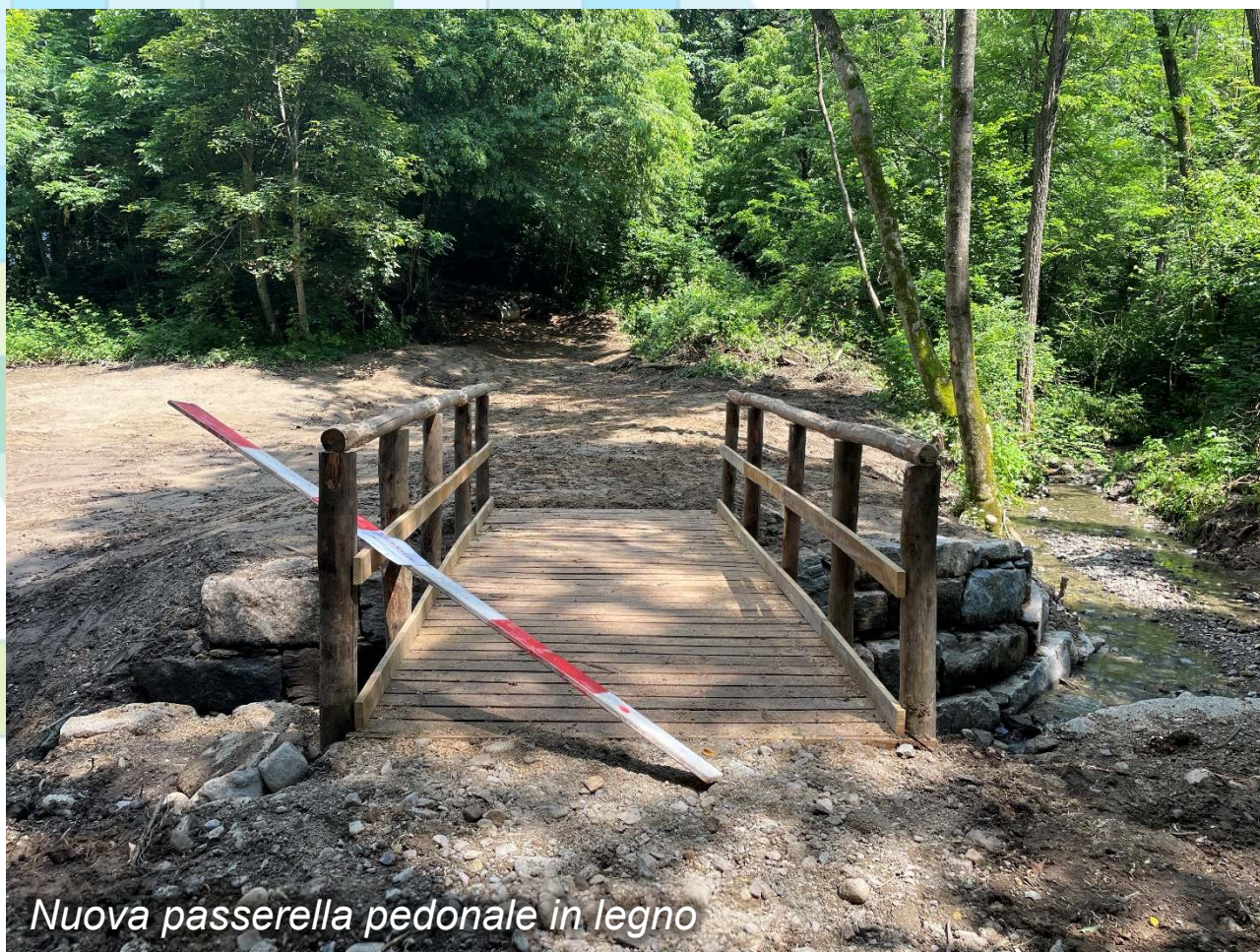
Nuova passerella pedonale in legno

Demolizione ponte esistente in calcestruzzo e successivo rifacimento del manufatto in legno, con spalle in massi in pietra naturale.