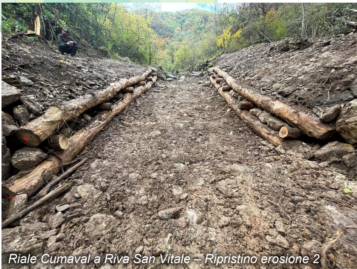
Riale Cumaval a Riva San Vitale – Ripristino erosione 2