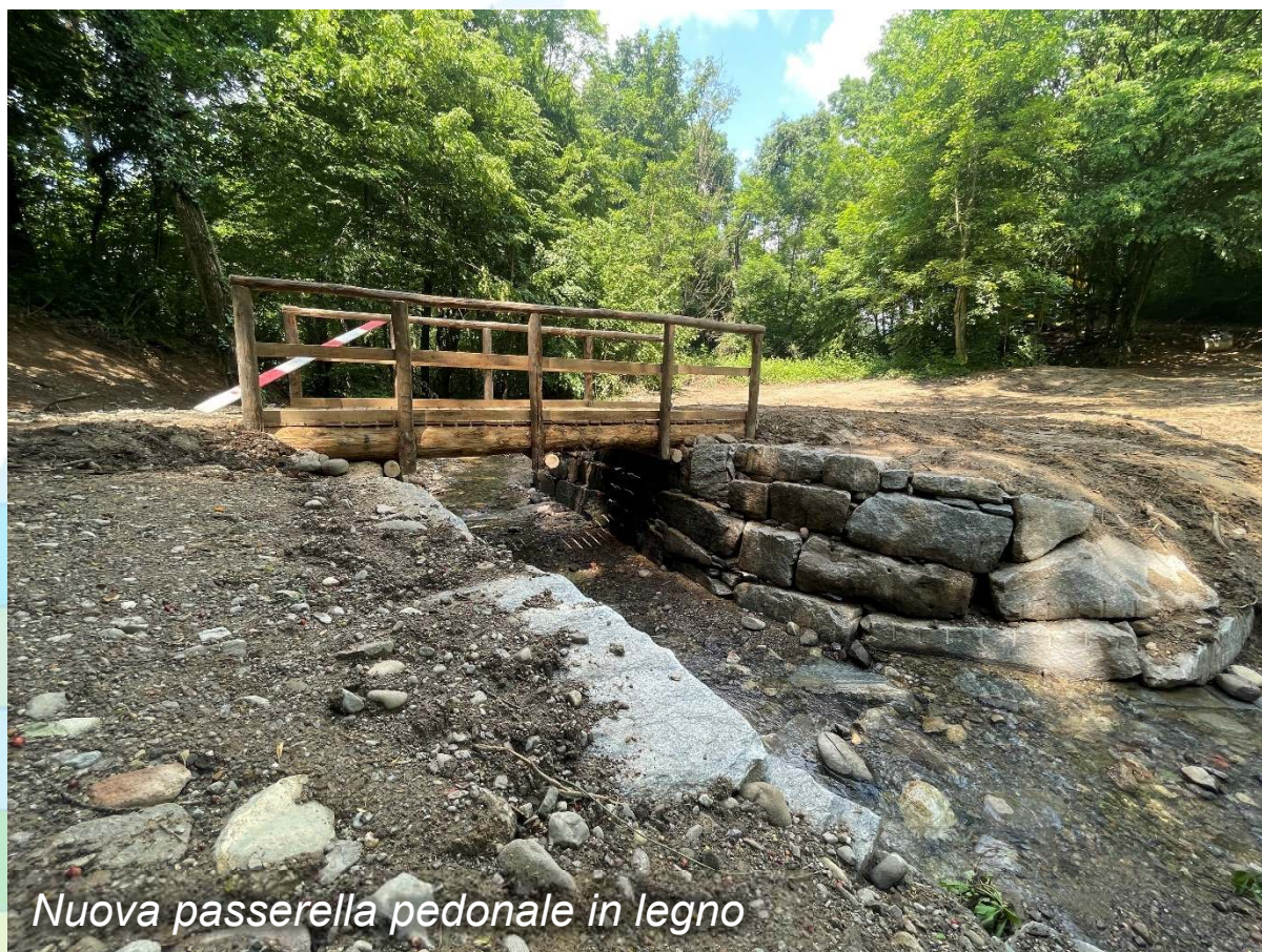
Nuova passerella pedonale in legno