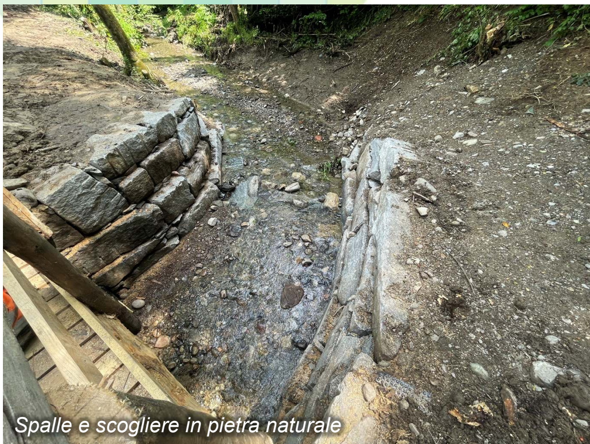
Spalle e scogliere in pietra naturale