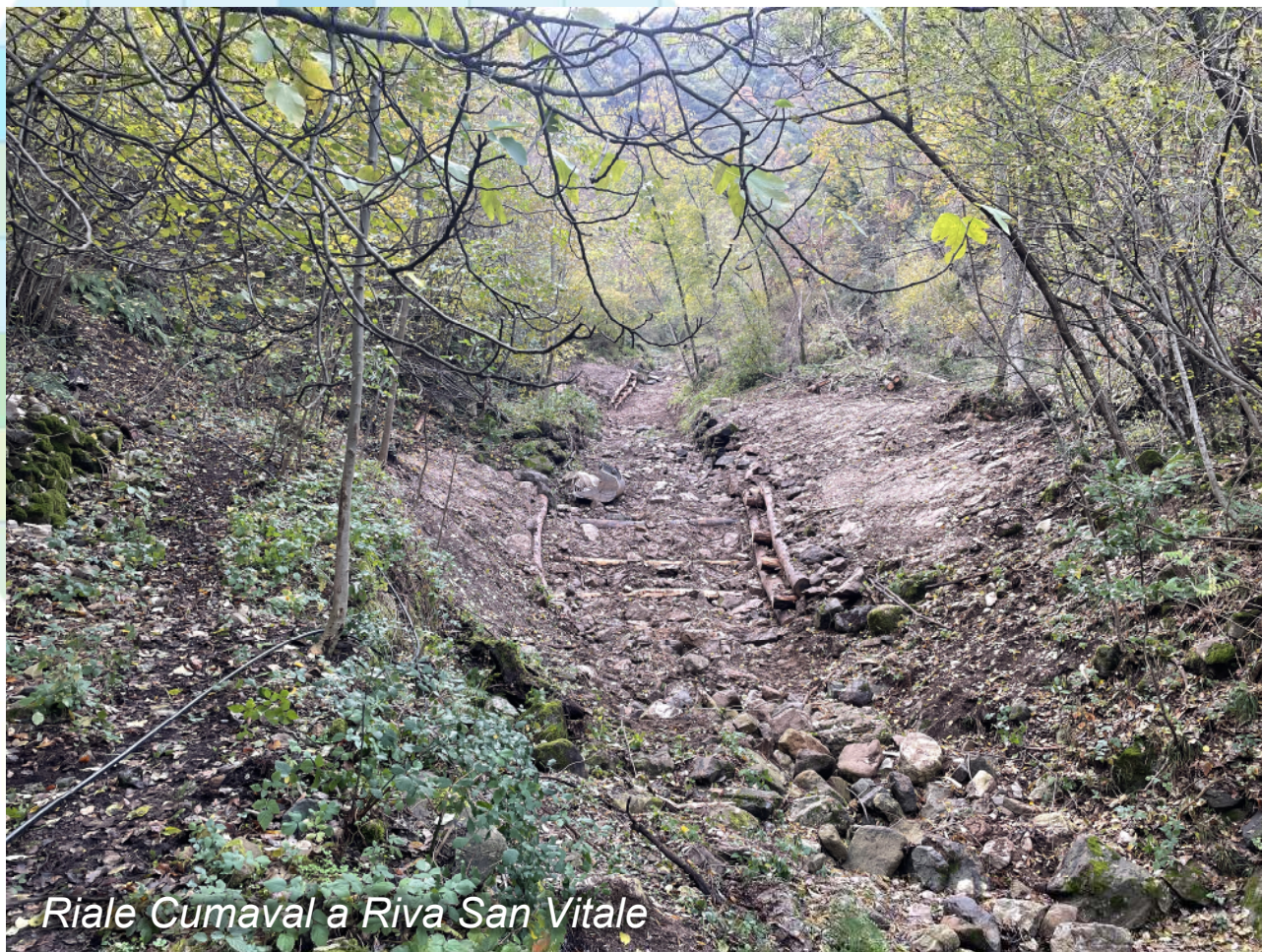
Riale Cumaval a Riva San Vitale

Ripristino e consolidamento del fondo e delle sponde del riale Cumaval a Riva San Vitale, soggetto a erosioni in no. 3 punti, mediante realizzazione di traverse doppie in legno, rampe in pietra naturale e palificate (novembre 2022).