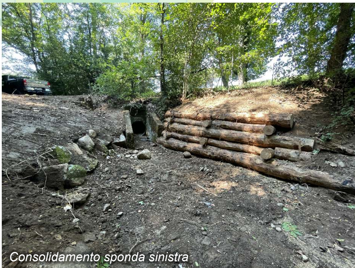
Consolidamento sponda sinistra