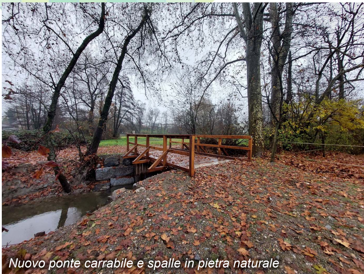
Nuovo ponte carrabile e spalle in pietra naturale