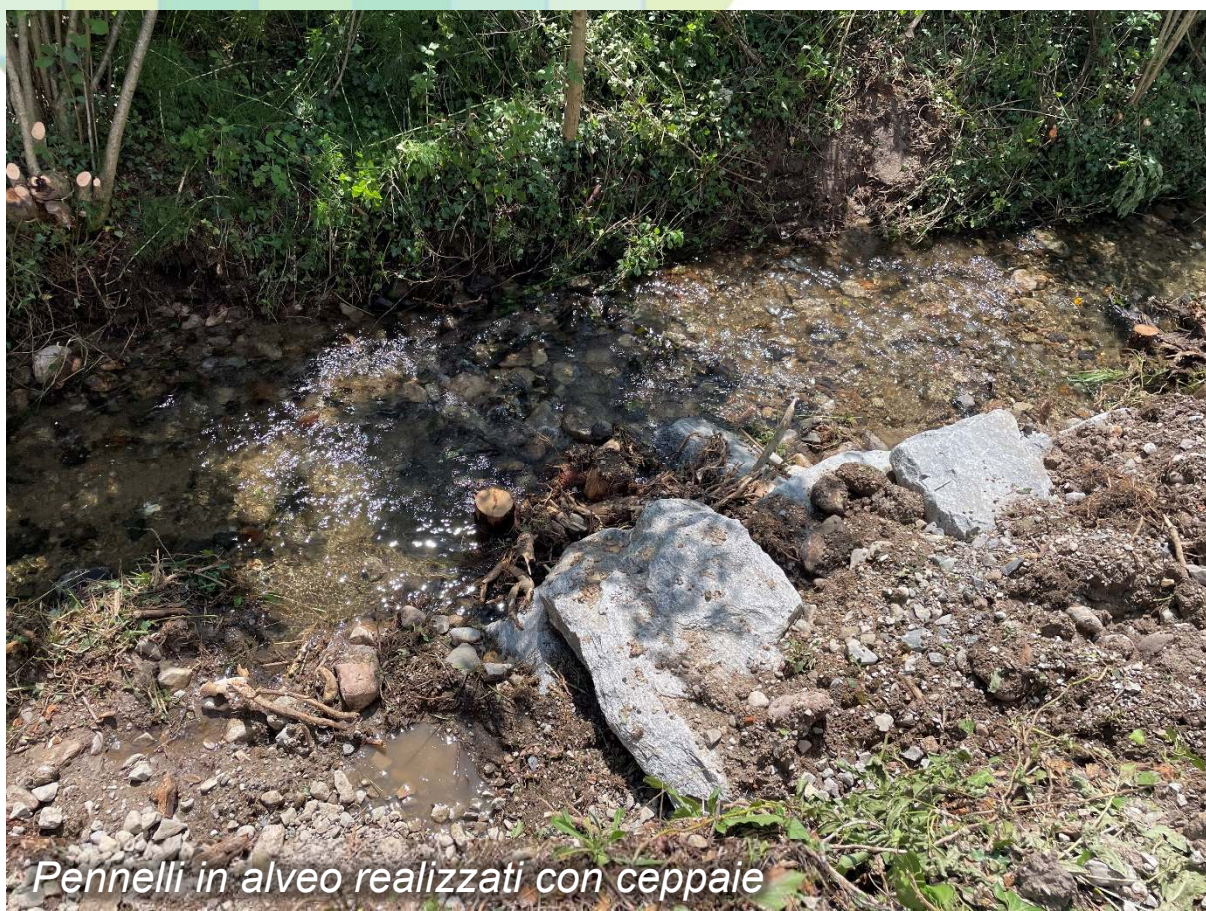
Pennelli in alveo realizzati con ceppaie