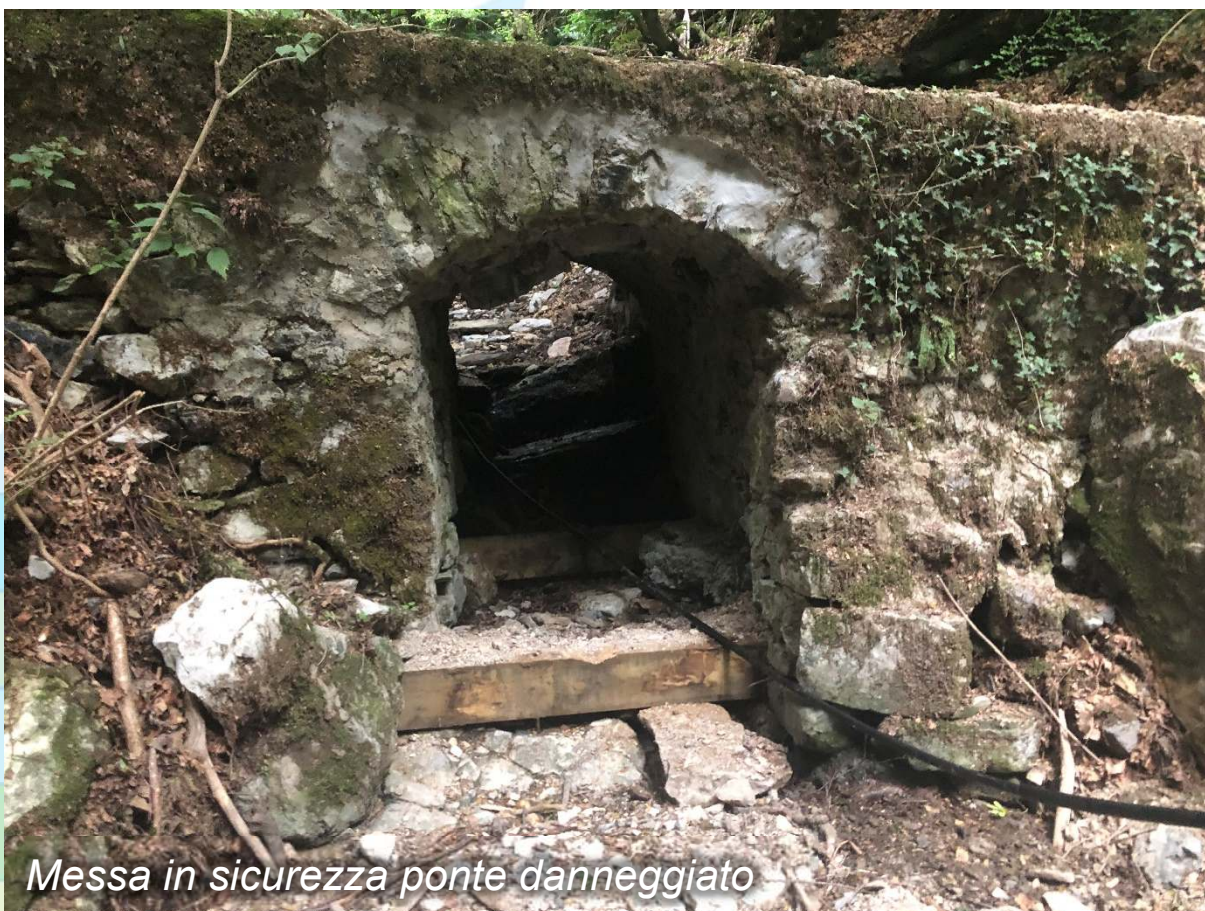
Messa in sicurezza ponte danneggiato