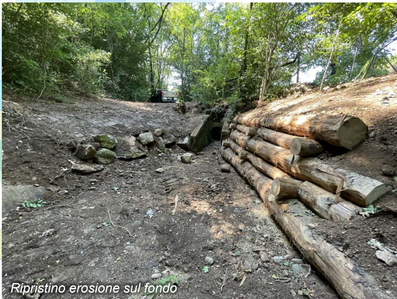
Ripristino erosione sul fondo

Ripristino erosione sul fondo presso l'uscita dal tombinone (con posa massi granitici sul fondo) e consolidamento degli argini.