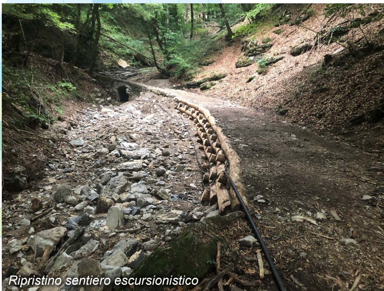
Ripristino sentiero escursionistico

Ripristino di un tratto di sentiero escursionistico in loc. Lardai a Mendrisio-Salorino, danneggiato dalla fuoriuscita di acqua e materiale dal vicino corso d'acqua a causa dell'ostruzione di un ponte. Messa in sicurezza del ponte danneggiato a seguito dell'evento.