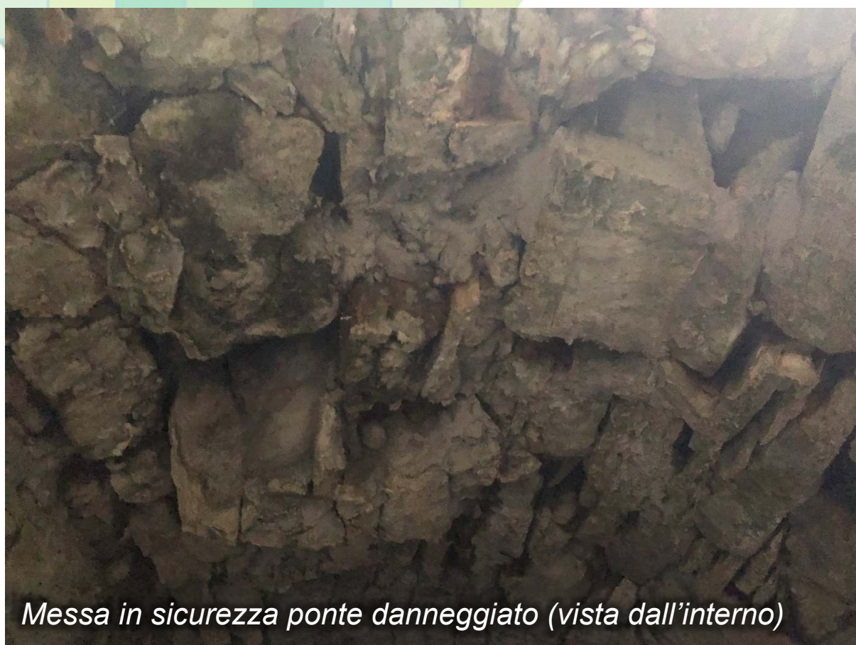
Messa in sicurezza ponte danneggiato (vista dall'interno)