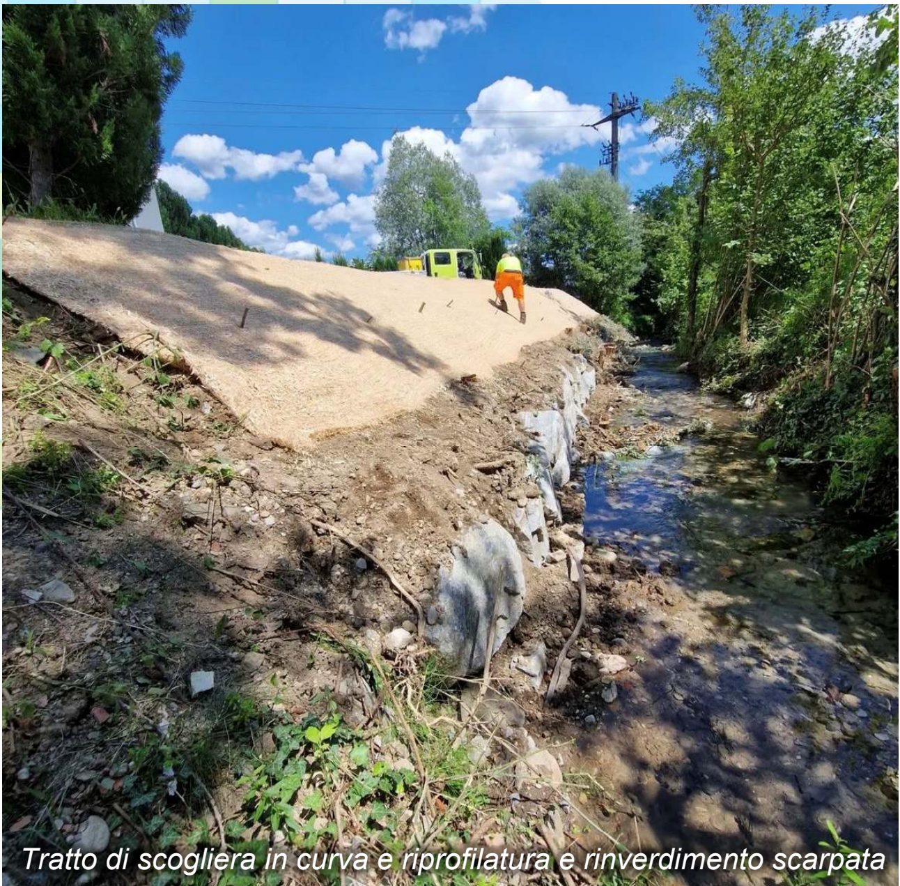
Tratto di scogliera in curva e riprofilatura e rinverdimento scarpata

Ripristino argine sottoposto a erosione mediante posa di scogliera nel tratto in curva e mediante posa di fascine nel tratto rettilineo e riprofilatura scarpata con pendenza dolce. Successivo rinverdimento della scarpata con semina e posa di talee di salice. Messa in sicurezza tracciato elettrico e camera elettrica esistenti.