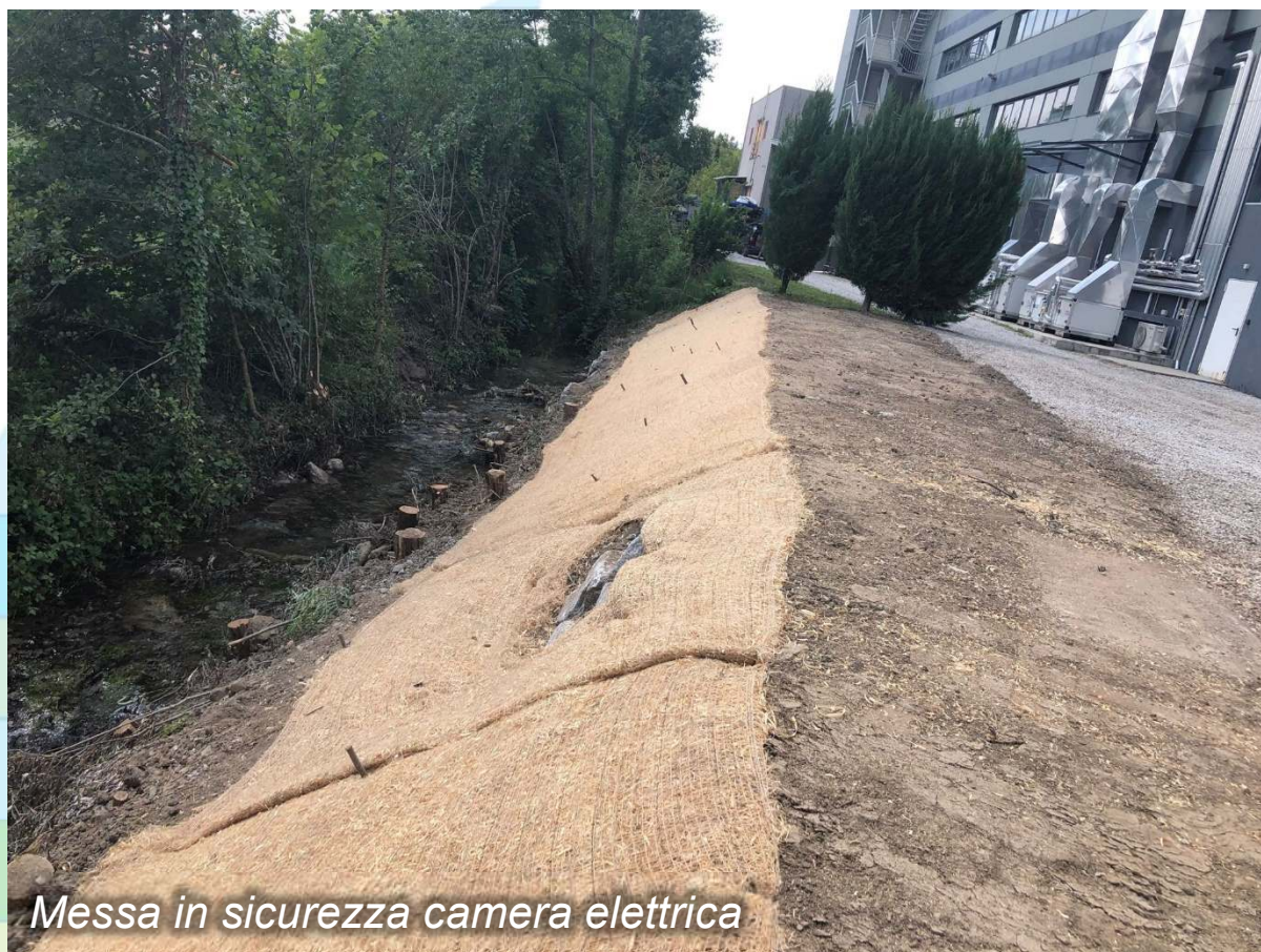
Messa in sicurezza camera elettrica