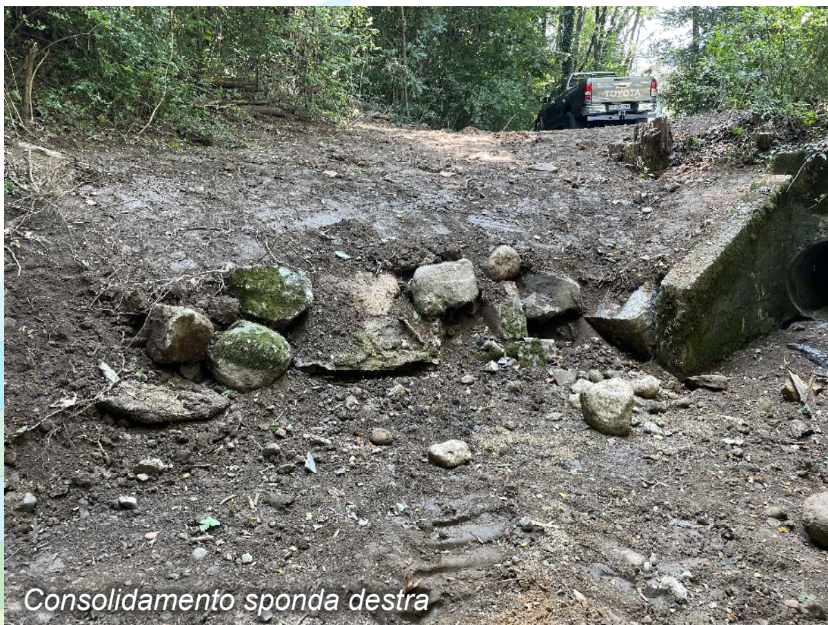
Consolidamento sponda destra