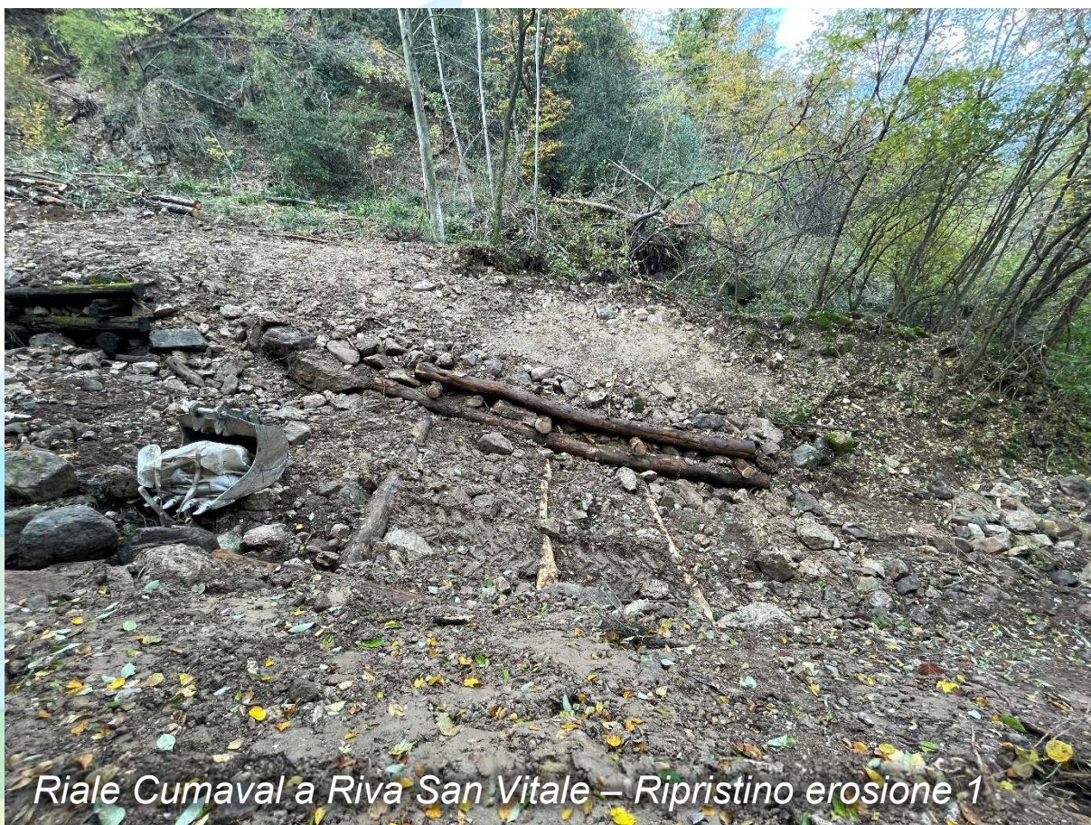
Riale Cumaval a Riva San Vitale – Ripristino erosione 1