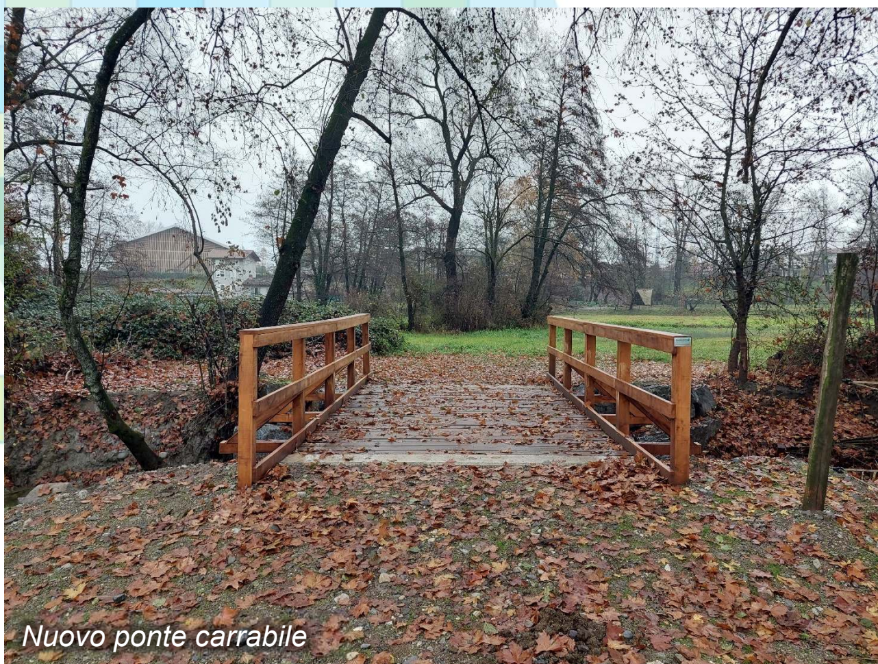
Nuovo ponte carrabile

Demolizione ponte esistente in calcestruzzo e successivo rifacimento del manufatto in calcestruzzo, acciaio e legno, con spalle in massi in pietra naturale.