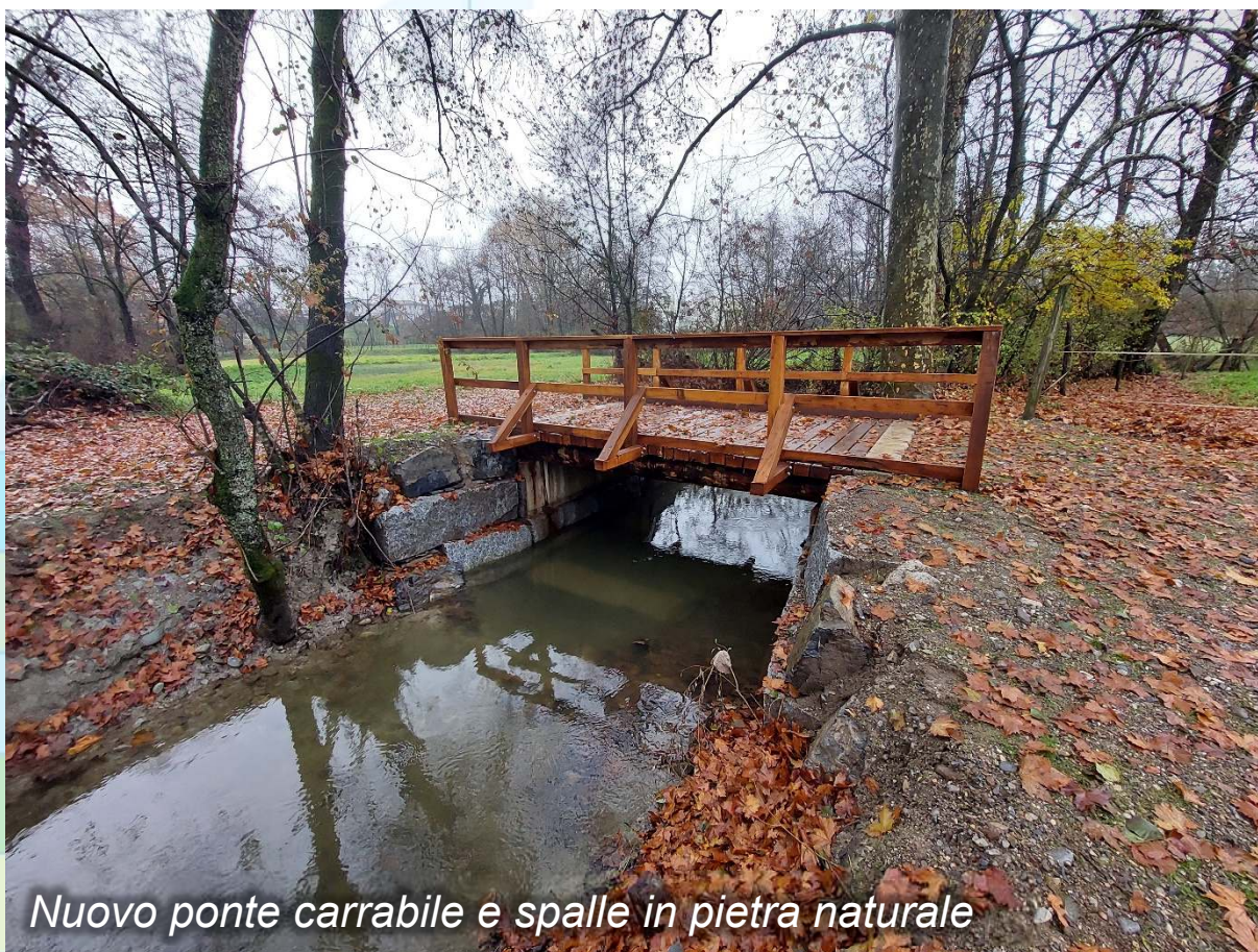
Nuovo ponte carrabile e spalle in pietra naturale